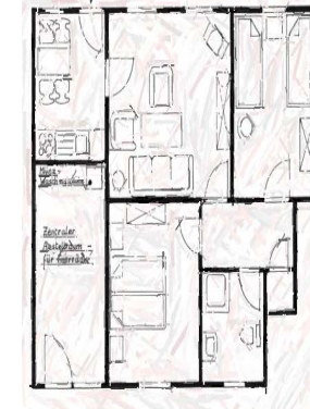
ca.52 m2 Grundriss Langeoog EG