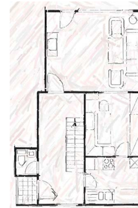
ca.86m2 Grundriss Juist EG

W-Lan Internetzugang über Umts Surfstick